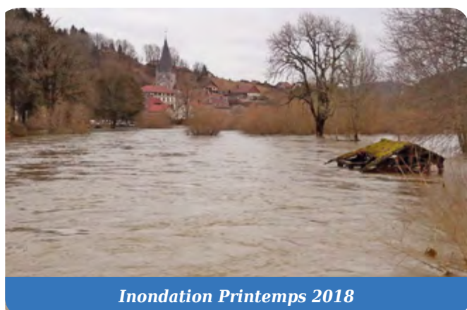
Inondation Printemps 2018